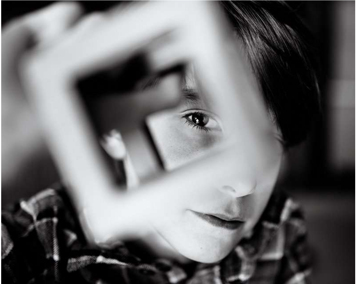
# 7 Здесь зима